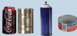
Metal cans, aerosol cans