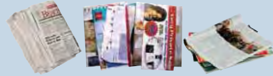
Newspaper, magazines, junk mail, paper