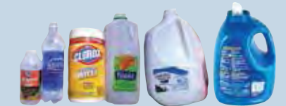
Botellas de plástico