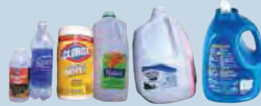
Plastic bottles and jugs