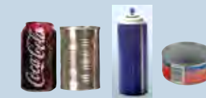
Latas de metal, latas de aerosol