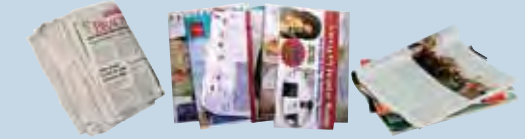
Periódicos, revistas, catálogos, sobres