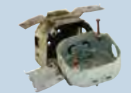
Chatarra de metal