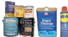
유성 페인트 + 솔벤트