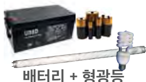
배터리 + 형광등